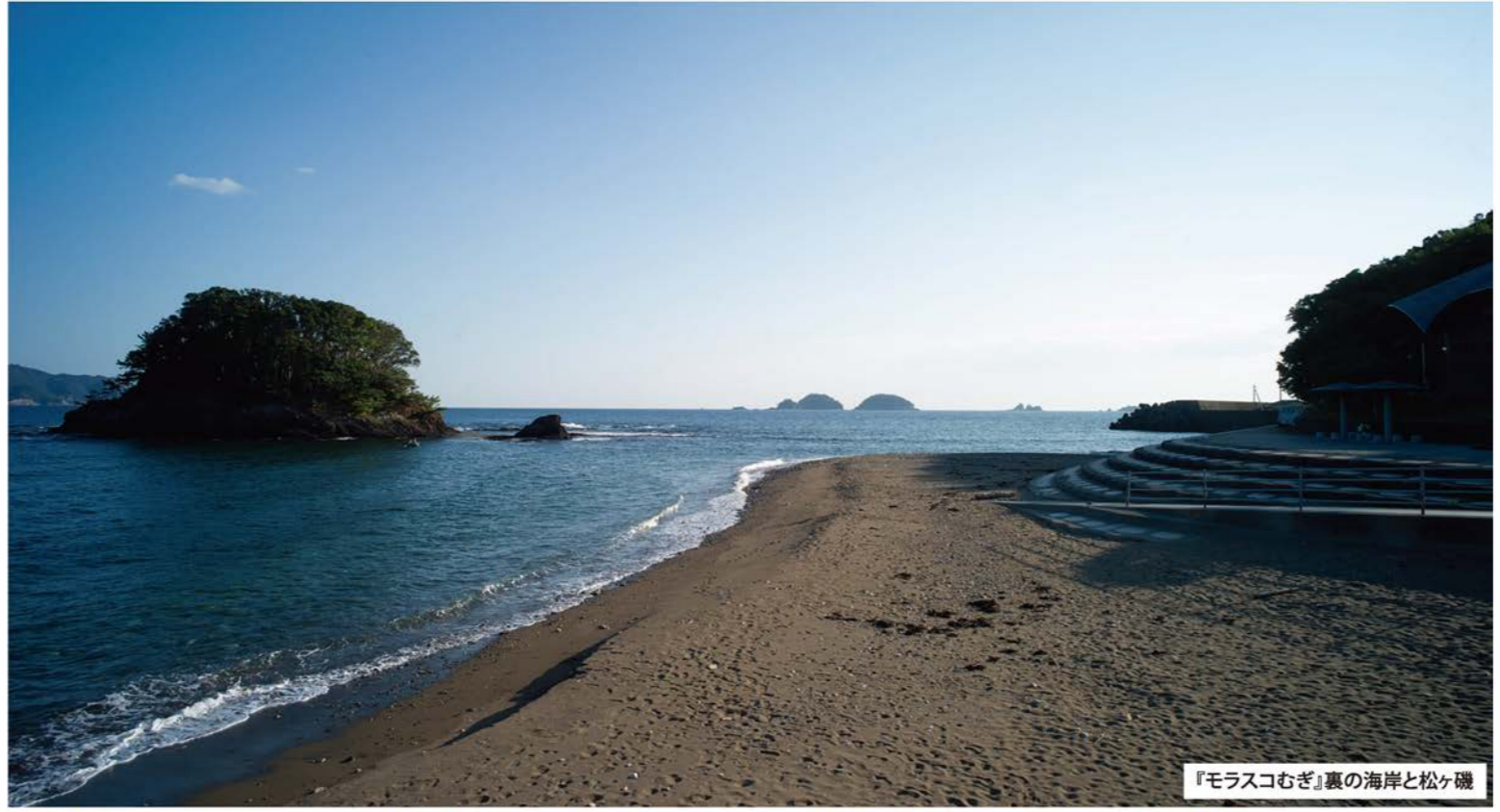
『モラスコむぎ』裏の海岸と松ヶ磯