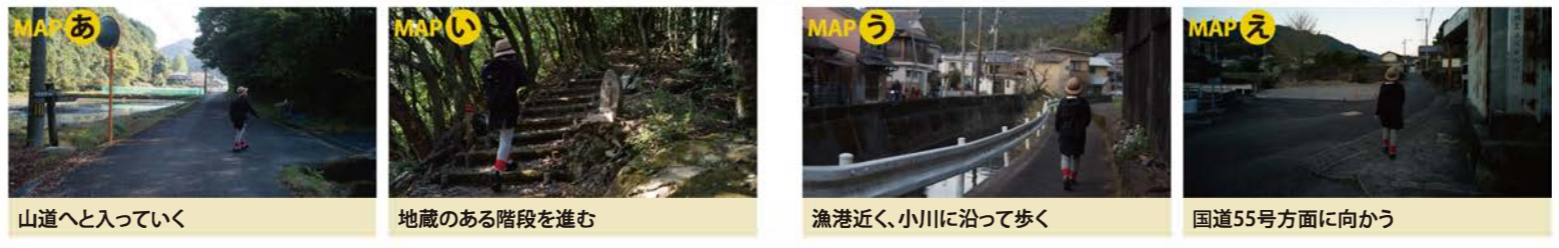
山道へと入っていく