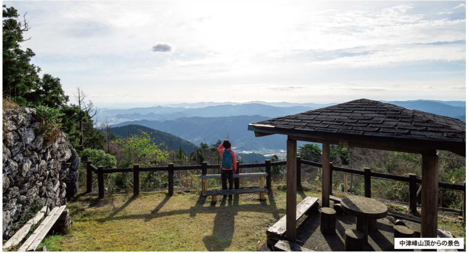
中津峰山頂からの景色