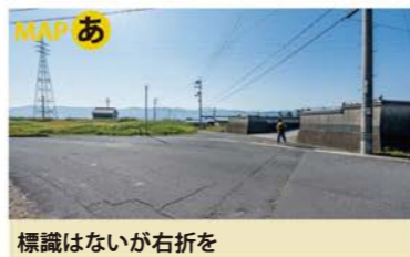
標識はないが右折を