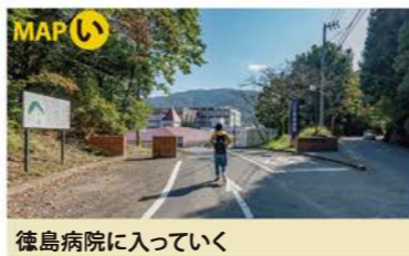
徳島病院に入っていく