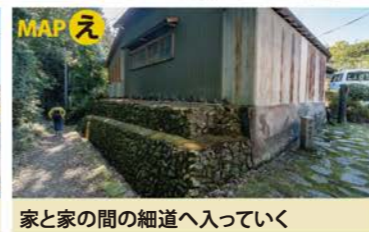
家と家の間の細道へ入っていく