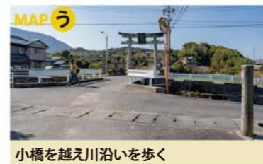
小橋を越え川沿いを歩く