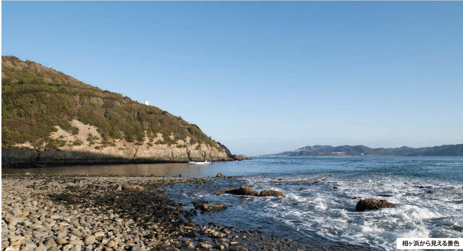
相ヶ浜から見える景色