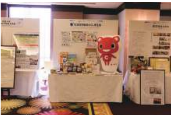
生活協同組合とくしま生協