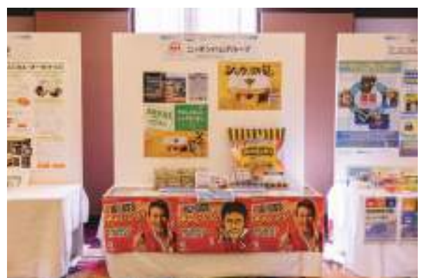
ニッポンハムグループ