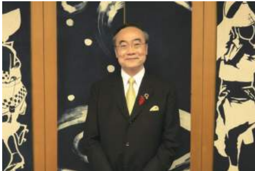
徳島県知事 飯泉 嘉門