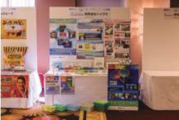
有限会社ハイプラ