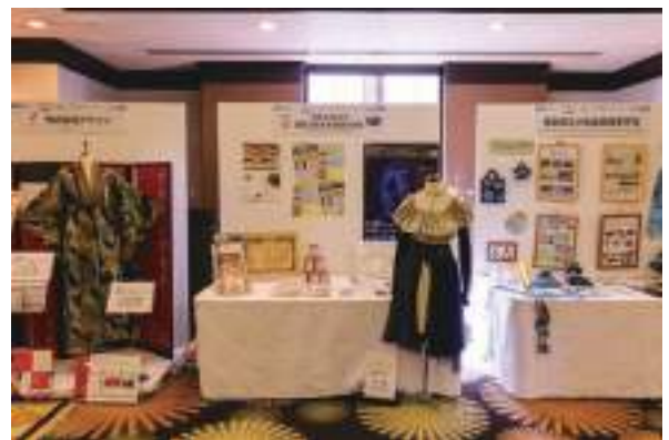
徳島文理大学・徳島文理大学短期大学部