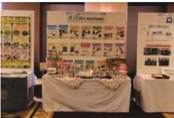
特定非営利活動法人とくしま障がい者就労支援協議会