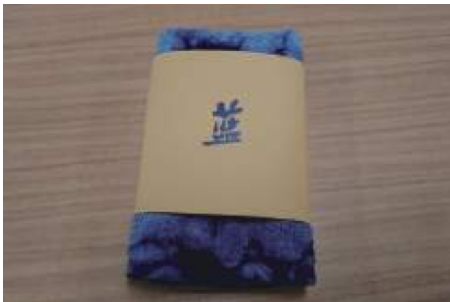
記念品(藍染めハンカチ)