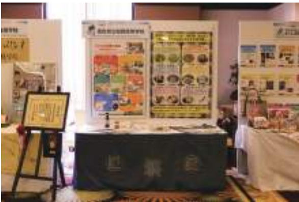
徳島県立城西高等学校