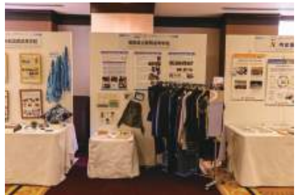
徳島県立那賀高等学校