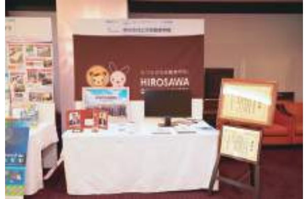
株式会社広沢自動車学校