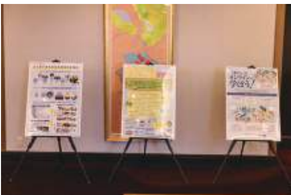
徳島県消費者政策課③