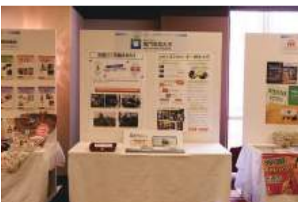
国立大学法人鳴門教育大学