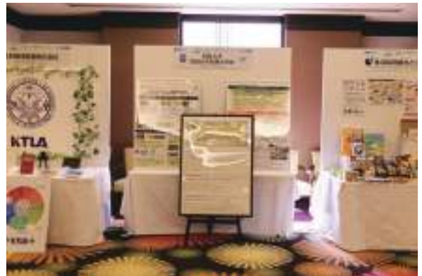
四国大学・四国大学短期大学部