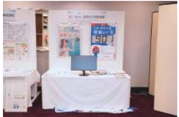
徳島県万博推進課