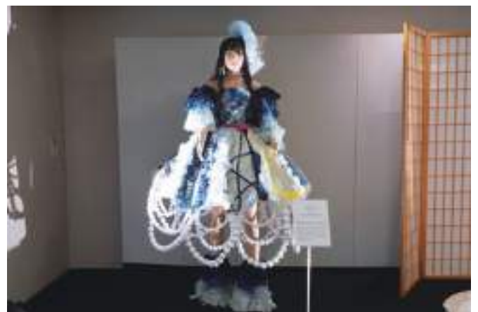
衣装提供 / 徳島県立小松島西高等学校