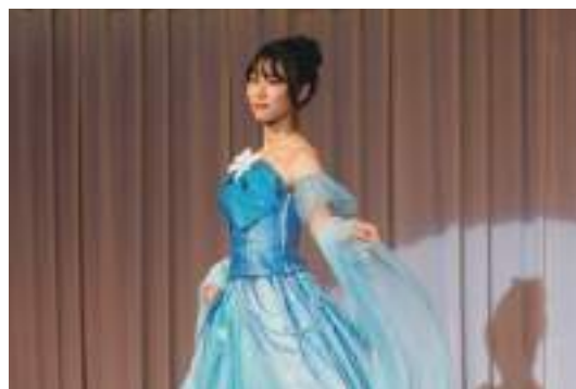
和服リメイク 協力 / 株式会社アゲイン