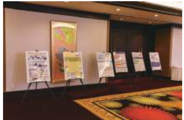
徳島県消費者政策課②