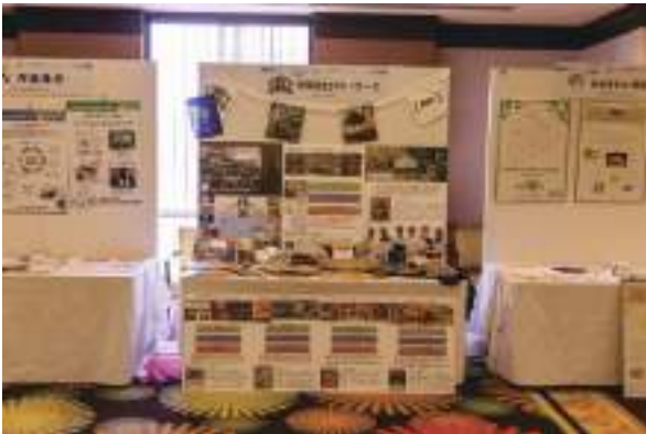
有限会社ウト・ワーク