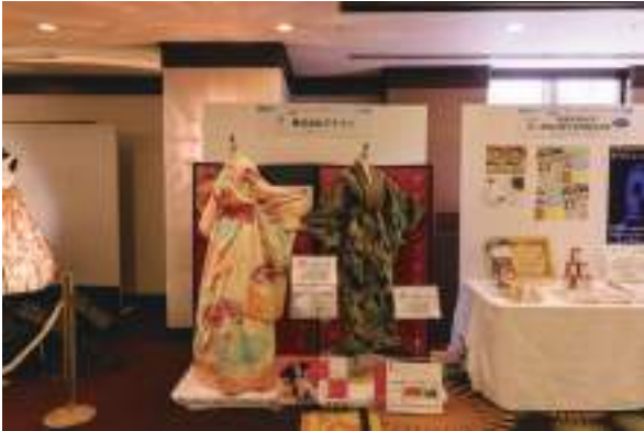
株式会社アゲイン