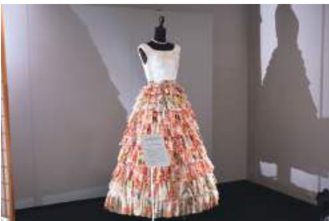
衣装提供 / 徳島文理大学短期大学部