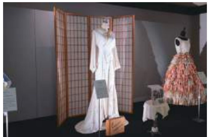
衣装提供 / 株式会社アゲイン