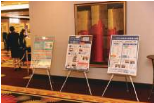
徳島県消費者政策課①