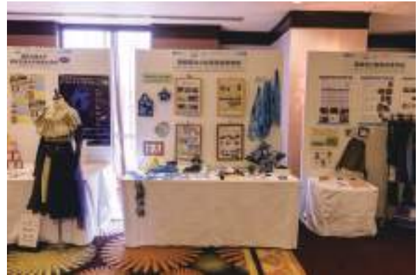
徳島県立小松島西高等学校