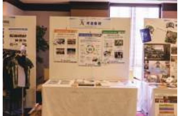
株式会社阿波銀行