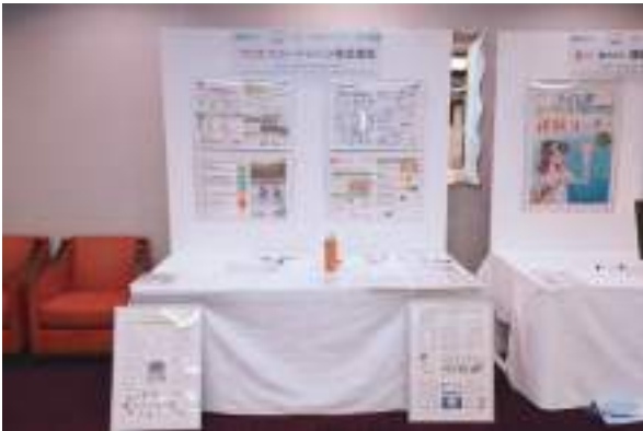
リコージャパン株式会社