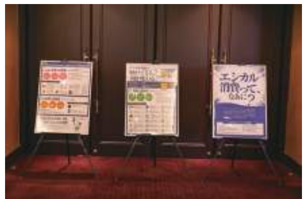
徳島県消費者政策課④