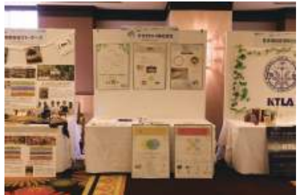
きせきれい株式会社