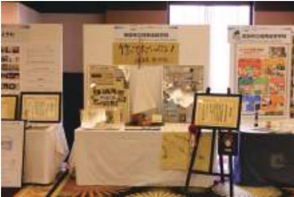
徳島県立阿南支援学校