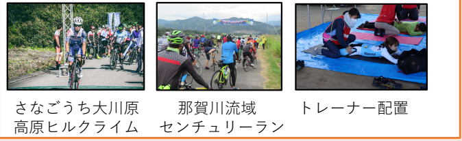
さなごうち大川原 那賀川流域 トレーナー配置 高原ヒルクライム センチュリーラン