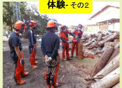
チェーンソー体験