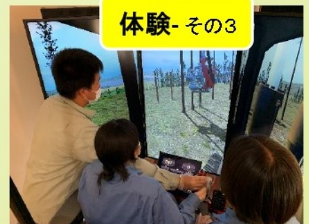
ハーベスタシミュレータ体験

問合先： ☎770-0045 徳島市南庄町5丁目1-9 県木材利用創造センター内「林業人材育成棟」 TEL 088-635-7812 FAX 088-661-6055 ホームページ：tr-academy.net mail: i@tr-academy.net