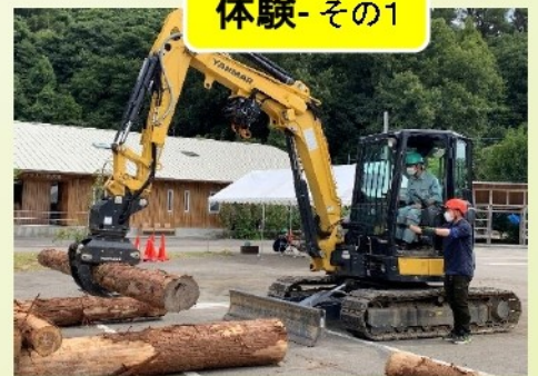
グラップル体験（高性能林業機械）