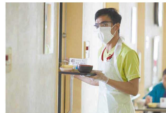
Menyiapkan makan siang dan tentu saja membantu proses makan.