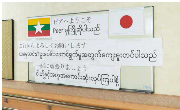
Ada pesan selamat datang dalam bahasa Burma (Myanmar) di aula depan!

Sekitar tiga tahun lalu, kami mulai menerima orang asing. Saat ini, kami memiliki empat orang Myanmar yang bekerja di fasilitas kami. Pada awalnya saat menerima orang Vietnam, saya khawatir apakah mereka bisa bergaul dengan baik dengan staf Jepang, dan juga apakah mereka akan bertahan lama, tetapi mereka bisa segera beradaptasi.