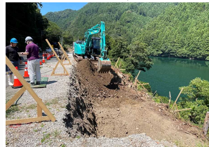
進捗状況写真 8月1日撮影