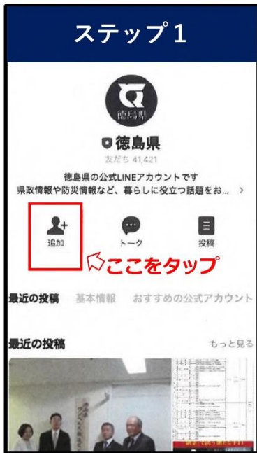
徳島県公式LINEを友だち追加する。 ※登録済みの方はステップ2へ！