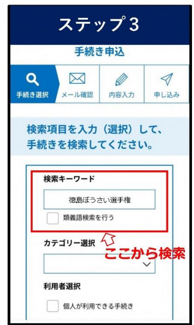
「徳島ぼうさい選手権」を入力の上、検索して申請する。