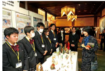
高校生による伝統文化継承等の取組紹介