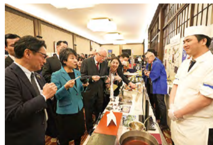
半田そうめんの試食