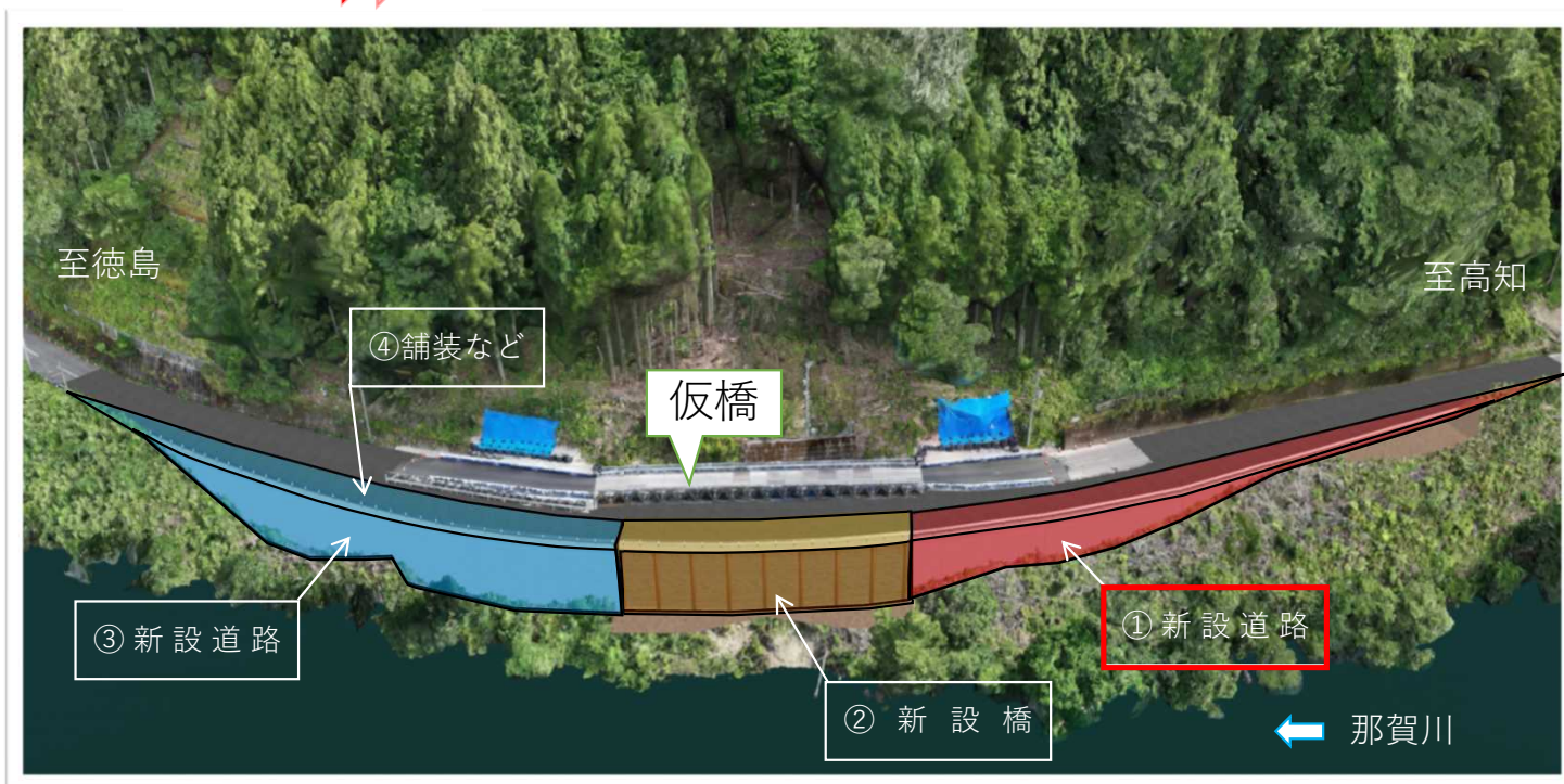
進捗状況写真 4/15時点