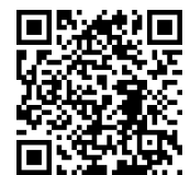
【動画】 高校生スタディツアー (徳島県)

職場体験など、本物に触れる体験を通して、リアルに生きる姿や社会を支える多様な役割を目の当たりにして、学ぶことや働くことの意義を理解し、生きることの尊さを実感できる活動を重視