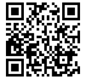
【動画】 小学生職業体験 (徳島県)

学校での係活動や地域との体験活動などを通して、自分や周りの人のために働くことの大切さについて話し合い、自分の役割や責任、自他の良さを考えて、お互いに高め合っていく活動を重視