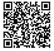
【動画】 ICTで新しい学びを (徳島県教育委員会)