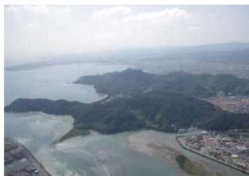
日の峰大神子風致地区