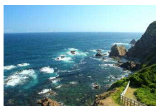
室戸阿南海岸国定公園

本県は、森林が県土の4分の3にあたる314,922haを占める森林県であり、木材生産はもとより、県土の保全、水資源のかん養、野生生物の息や県民の保健・休息の場、そして二酸化炭素を吸収・固定し地球温暖化を抑制するなど、様々な恵みをもたらしています。このため、森林の保全にあたり地域森林計画を策定し適切な管理と森林整備を進めているほか、森林の有する公益的機能の保全のために保安林の指定を行っており、令和4年度末現在、117,291haの保安林を指定しています。