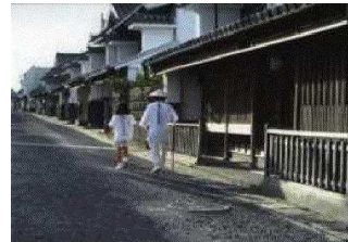
歴史的文化的街並み

貴重な動植物や地質鉱物の保護・管理のために、国や県、市町村では文化財保護法や文化財の保護に関する条例等に基づき、文化財の指定を行っています。本県では、動物13件（うち国指定10件）、植物62件（同11件）、地質・鉱物11件（同4件）の指定が行われているほか、市町村指定の天然記念物は、140件を超えています。また、県では、16名の文化財巡視員を配置し、その管理を図っています。