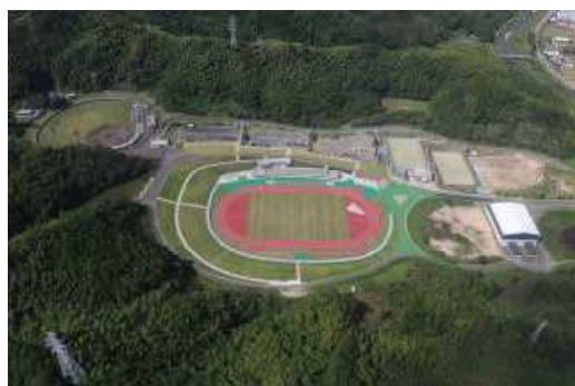
南部健康運動公園

風致の適切な維持に努め、都市の自然と美しい景観を守り、調和のとれた住みよいまちづくりを図ります。