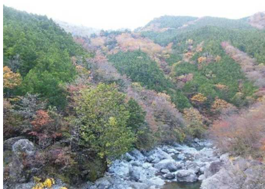
多様な機能を有する森林

今後も、間伐等による健全な森林整備や保安林の指定などにより森林の適切な保全・管理を図るとともに、県民が森と親しめる機会を拡充していきます。