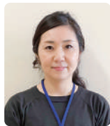
南部総合県民局 保健福祉環境部 <阿南>