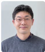
医療政策課 地域医療推進幹