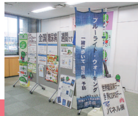
▲ 糖尿病に関する展示