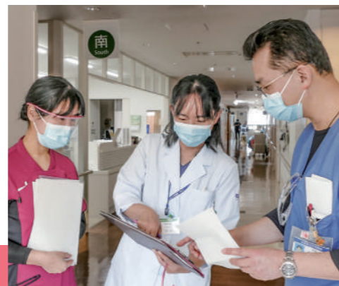
▲ 緩和ケアチーム回診

栄養管理は全ての疾病治療に共通する最も基本的な医療の一つです。病院管理栄養士は、医療チームの一員として、病気の治療、再発防止、合併症の予防に貢献できるよう、病院給食の提供や患者さん一人一人の病状に合わせた栄養管理・指導を行っています。管理栄養士は栄養サポートチームをはじめ、多くのチーム医療において重要な一員です。チーム医療に参加し、医師や看護師など多職種のスタッフと連携しながら栄養に関する提案を行ったり、食事摂取量が少ない患者さんにはベッドサイドで直接お話を伺いながら食事調整を行っています。また、栄養指導では幅広い疾患に対して個々の患者さんのライフスタイルを尊重した指導ができるようスタッフ一同日々研鑽しています。