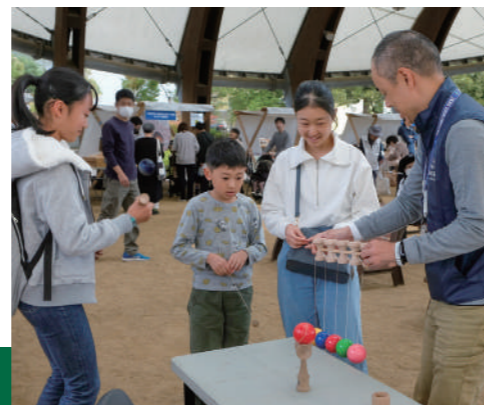
▲ とくしま木づかいフェア2023

当課は、計画的な森林の管理やシイタケの生産等を支援する「森林企画担当」、多様な主体による森林整備を進める「公有林化担当」、山の仕事の支援や担い手対策を進める「造林・担い手担当」、森林から生産される木材の利用を進める「木材需要・木育担当」の4つの担当で構成されています。林業に関する様々な業務を通じて、徳島の森林を次世代につなげるという役割を担っています。