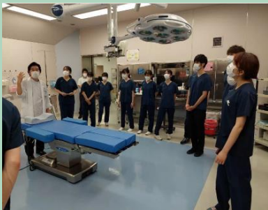
徳島県内病院見学