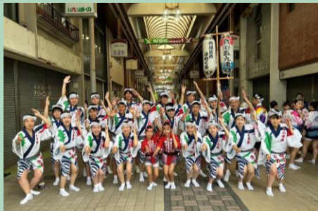
地医輝連 阿波踊り