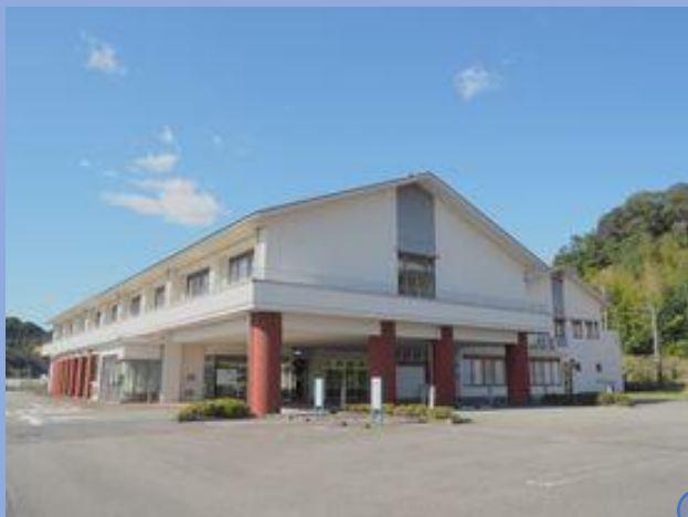
海陽町立 海南病院