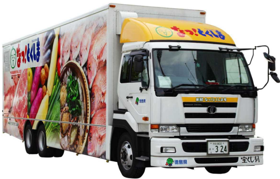
新鮮な県産食材をプリントしたデザイン