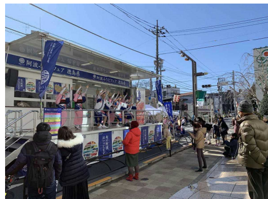
舞台機能を活用したイベントの実施