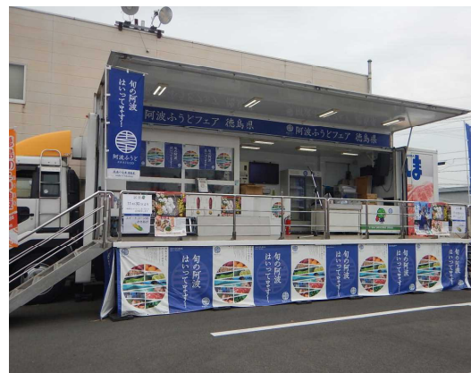
広々とした舞台スペース