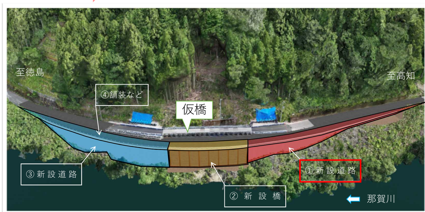
進捗状況写真 3/14撮影