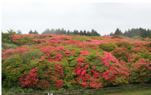
船窪オンツツジ群落

私たちは自然環境に親しみ、レクリエーションを楽しむことができます。また、自然は私たちの目を楽しませてくれたり、信仰の対象、教育の場になったりすることもあります。美しい山容から「阿波富士」と呼ばれる高越山は古くから信仰の山として祀られており、頂上付近に広がるオンツツジ群落は国指定天然記念物に指定されています。また、同じく国指定天然記念物の母川のオオウナギ生息地には、オオウナギがせり割ったという伝説の「せり割り岩」が残っています。