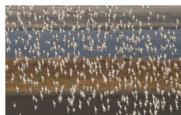
吉野川を飛翔する野鳥

徳島県は、東西方向に山地や河川が分布し、北部は小雨地域、南部は多雨地域に属するなど、気候が複雑で変化に富んでいます。「種の多様性」とは、このような異なった環境に適応し、いろいろな動物・植物が生息・生育していることです。