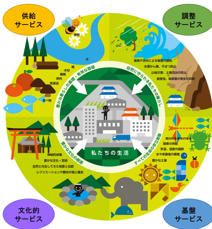
「私たちの生活と生態系サービス」

また、食物連鎖を支える一次生産は、植物が太陽エネルギーを利用して担い、栄養豊かな土壌は、生物の死骸がバクテリアなどの土壌中の微生物に分解されることなどにより形成され、生命の維持に欠かせない水や生物の豊かな海に不可欠な窒素・リンなどの栄養塩の循環には、森林などの水源涵養の働きや栄養塩の供給が大きな役割を果たしています。気温・湿度の調節も大気の循環や森林などを構成する植物からの蒸散により行われています。このように、人間を含むすべての生命の生存基盤である環境は、こうした自然の物質循環を基礎として成り立っています。