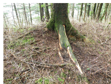
ニホンジカによる食害 (ダケモミの樹皮はぎ)

第2の危機は、第1の危機とは逆に、自然に対する人間の働きかけが縮小撤退することによる生物多様性への悪影響であります。人口減少や高齢化により、自然に対する働きかけの縮小により、人手が加えられることによって維持されてきた里地里山の生態系が劣化してきています。また、耕作放棄地や放置された里山林の増加は、ニホンジカ・ニホンザル・イノシシの個体数の著しい増加をもたらし、農林業被害を深刻化させています。