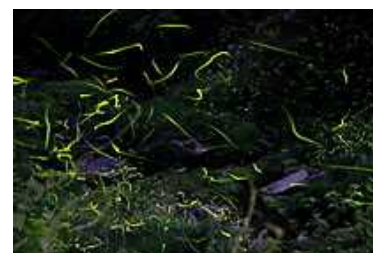
美郷地区のゲンジボタル

「遺伝子の多様性」とは、同じ種でも異なる遺伝子を持っていたり、集団間で遺伝子頻度が異なっていたりすることです。例えば、ゲンジボタルという種は、西日本と東日本では発光周期が異なっており、これは2つの地域で遺伝子が異なっていることに起因します。