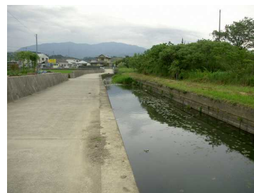
直線化された水路

第1の危機とは、開発や乱獲など人が引き起こす負の要因による生物多様性への悪影響であります。沿岸域の埋立による干潟や湿地の消失、河川の直線化・固定化、ダム・堰の整備、大規模開発、水路の整備等による野生動植物の生息・生育環境の劣化が指摘され、県民が日常的に触れ合うことができる身近な自然が失われています。また、乱獲、盗掘、過剰な採取なども個体数の減少をもたらしています。