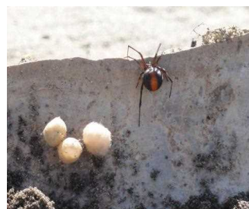
外来種（セアカゴケグモ）

3つの危機に加えて、地球規模で生じる地球温暖化が地球上の生物多様性に対して深刻な影響を与えつつあります。地球温暖化は、少しの温度変化であっても多くの種の絶滅や脆弱な生態系の崩壊などを引き起こす恐れがあります。