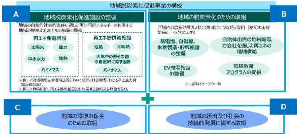
地域脱炭素化促進事業の構成

再エネを利用した地域の脱炭素化のための施設（地域脱炭素化促進施設）の整備及びその他の「地域の脱炭素化の取組」を一体的に行う事業であって、「地域の環境の保全のための取組」及び「地域の経済及び社会の持続的発展に資する取組」を併せて行うものです。