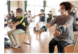
フレイル予防で健康長寿