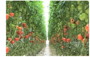
施設園芸団地の整備