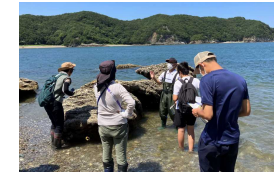
体験学習を通じた里海づくり活動