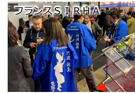
海外展示会での県産品PR