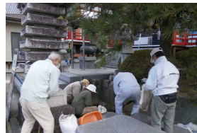
四国遍路札所の発掘調査