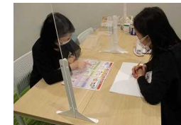
消費生活の窓口相談