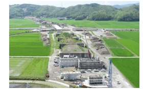
徳島南部自動車道(立江榊刈 I C)の整備