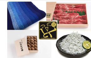
ふるさと納税返礼品