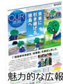
時代のニーズに対応した情報発信