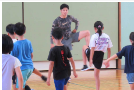
トップアスリートによるスポーツ教室