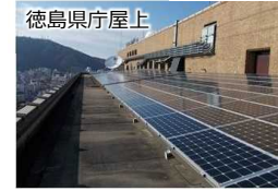
徳島県庁屋上 P P Aによる太陽光発電等率先導入