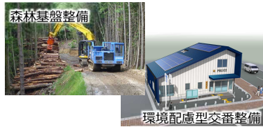
新たな資金調達手段 「徳島県SDGs債」の活用