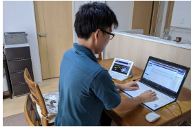
場所を選ばない多様な働き方