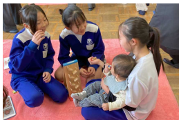
チーム育児の推進(赤ちゃん授業)