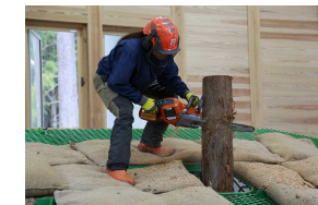
林業の担い手育成