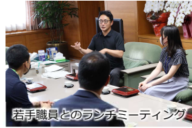
風通しの良い県庁組織