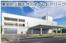
既存ストックの有効活用