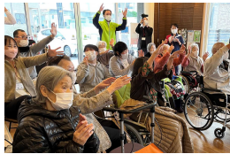
ユニバーサルカフェ