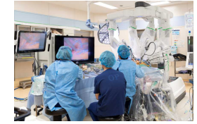
支援ロボットを用いた手術