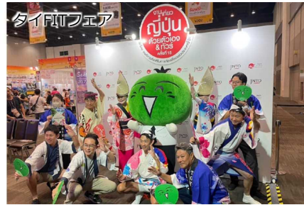
インバウンド誘客に向けたプロモーション