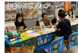
移住フェアでの個別相談