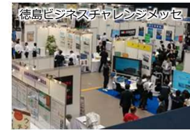
県内企業のビジネスチャンス創出