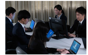
サイバー犯罪捜査