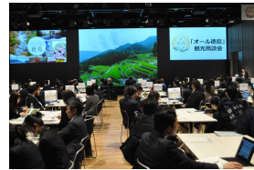
「オール徳島」観光商談会