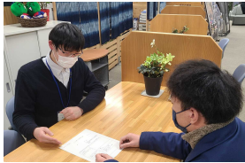
県庁情報公開請求窓口