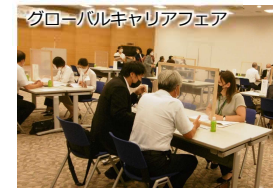
外国人材の就労・定着支援