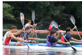
ドイツのカヌー選手と合同練習