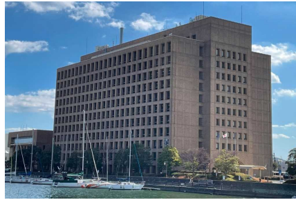
県民が主役となる県政の推進