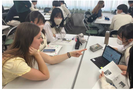
国際性に富む人材育成