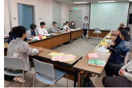
外国人のための日本語教室