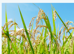
自分で収穫した米 を種籾として利用