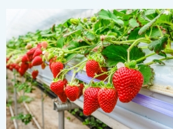
イチゴのランナーに よる苗の増殖