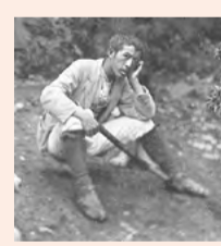
青年期の鳥居龍蔵

鳥居龍蔵(1870-1953)が青年期に5回行った台湾調査の資料は、現在、日本国内の数カ所に分散して保管されています。この展示では、それらの資料を一堂に集め、調査の全容を紹介するとともに、鳥居の台湾での足跡を詳細に再現します。 【とき】開催中~3月3日(日) 【観覧料】有料 【休館日】月曜日(祝日の場合開館、翌日休み) 【問】県立鳥居龍蔵記念博物館 ☎088-668-2544 FAX088-668-7197