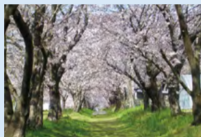
松島千本桜

私が紹介したいのは、毎年幻想的な世界観を生み出してくれる「松島千本桜」です。基本的に桜はどれも美しいと思いますが、松島にある、「松島千本桜」は一味違います。それは、以前に比べて本数は減ってしまいましたが、今でも350本を超えるソメイヨシノが並んでいることです。まるで青春をテーマにした物語のオープニングに出てくるような幻想的な世界観を、高齢の方から子供までみんなで楽しむことができます。華やかな桜たちが繰り広げる幻想的な世界観をぜひ楽しんでほしいと思います。