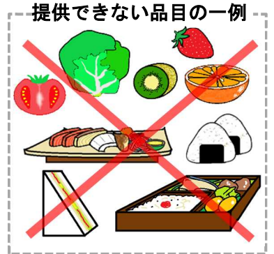
提供できない品目の一例