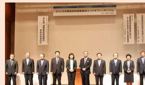
とくしま消費者志向経営推進組織設立(平成29年10月13日)