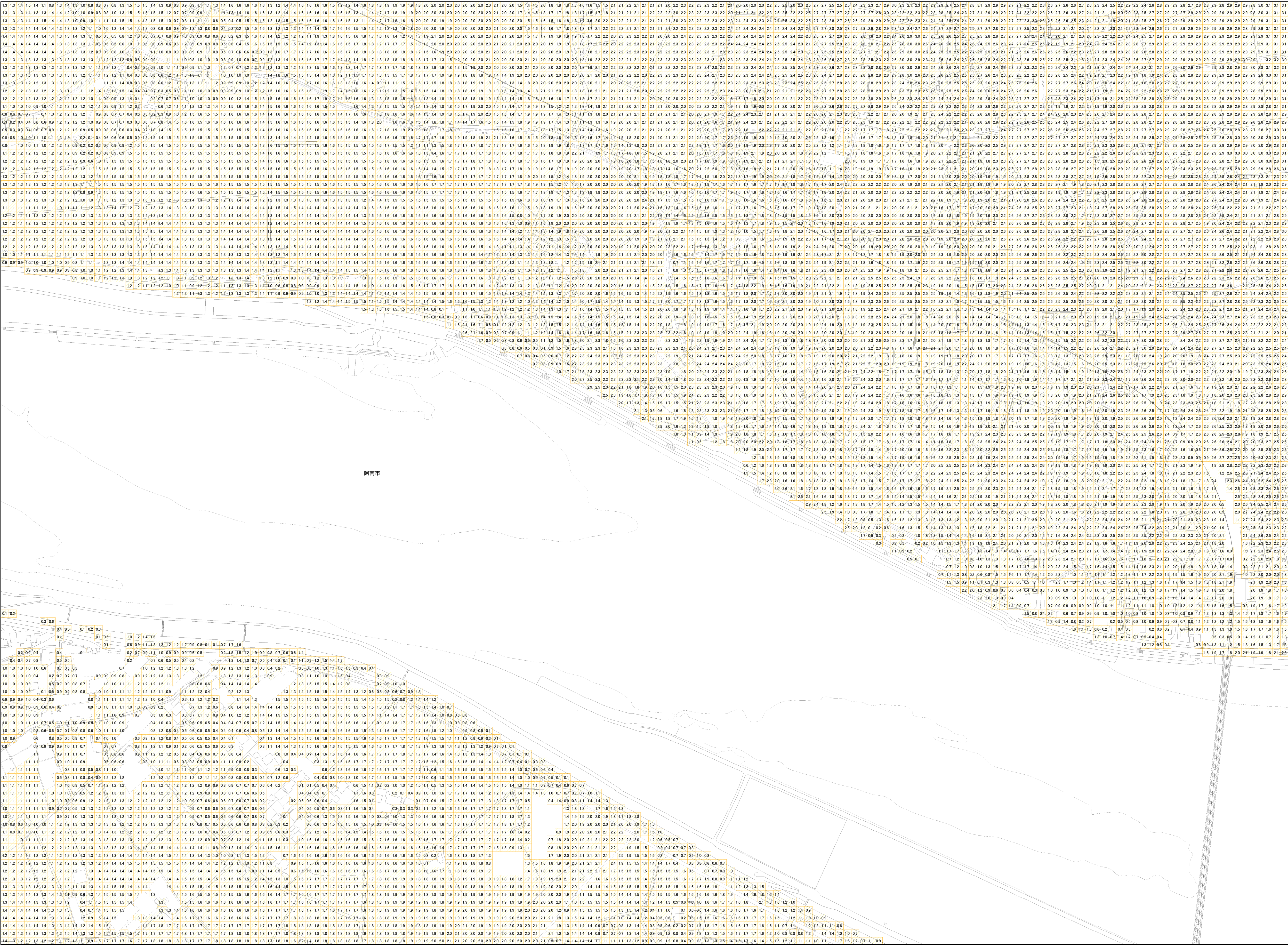
様式-2 津波災害警戒区域 区域図

【背景地図】 〇「背景地図」は、平成20年から21年の航空写真等を基に作成しているため、道路や建物などが現況と異なっている場合があります。