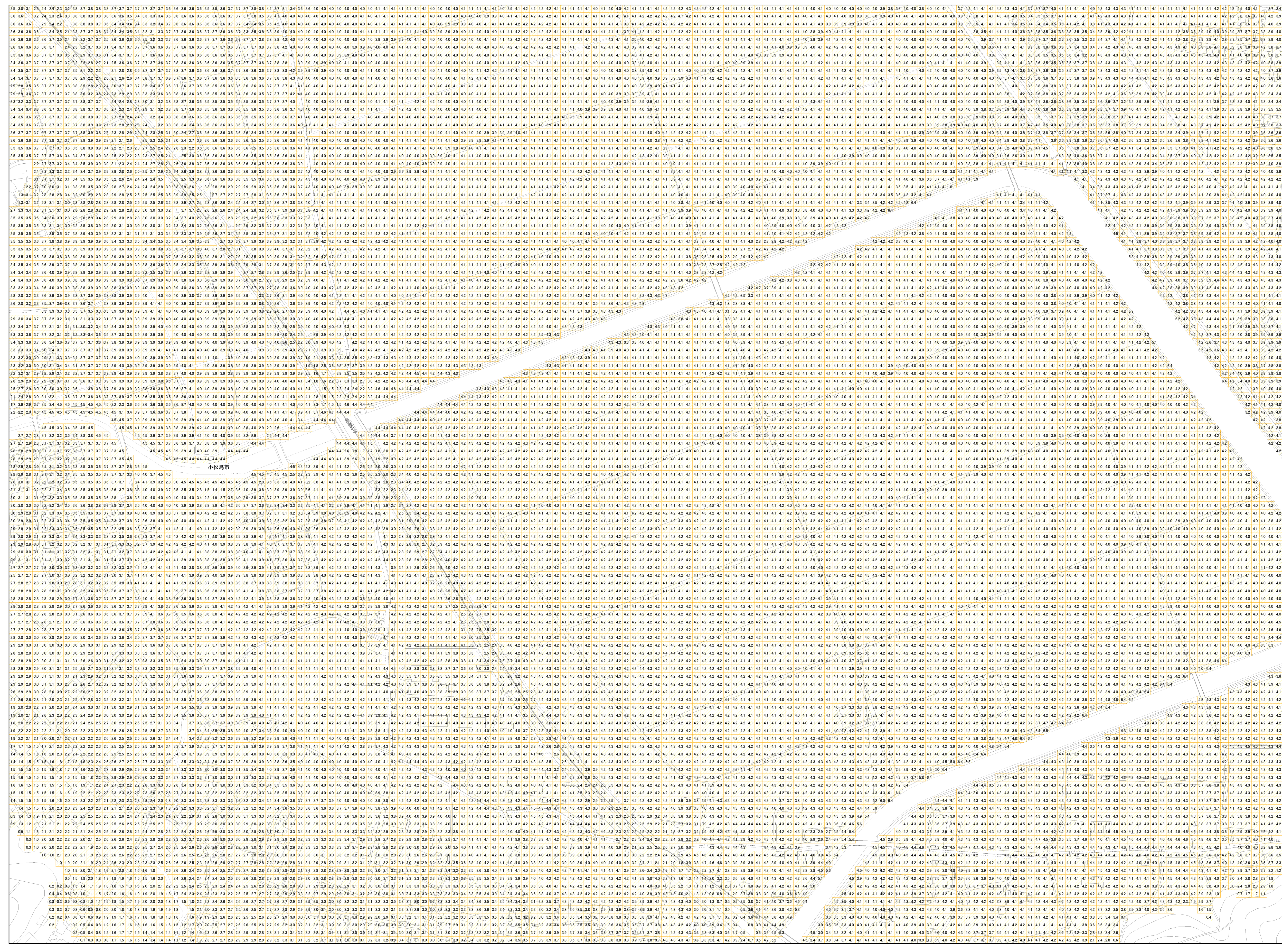
様式-2 津波災害警戒区域 区域図

【背景地図】 ○「背景地図」は、平成20年から21年の航空写真等を基に作成しているため、道路や建物などが現況と異なっている場合があります。