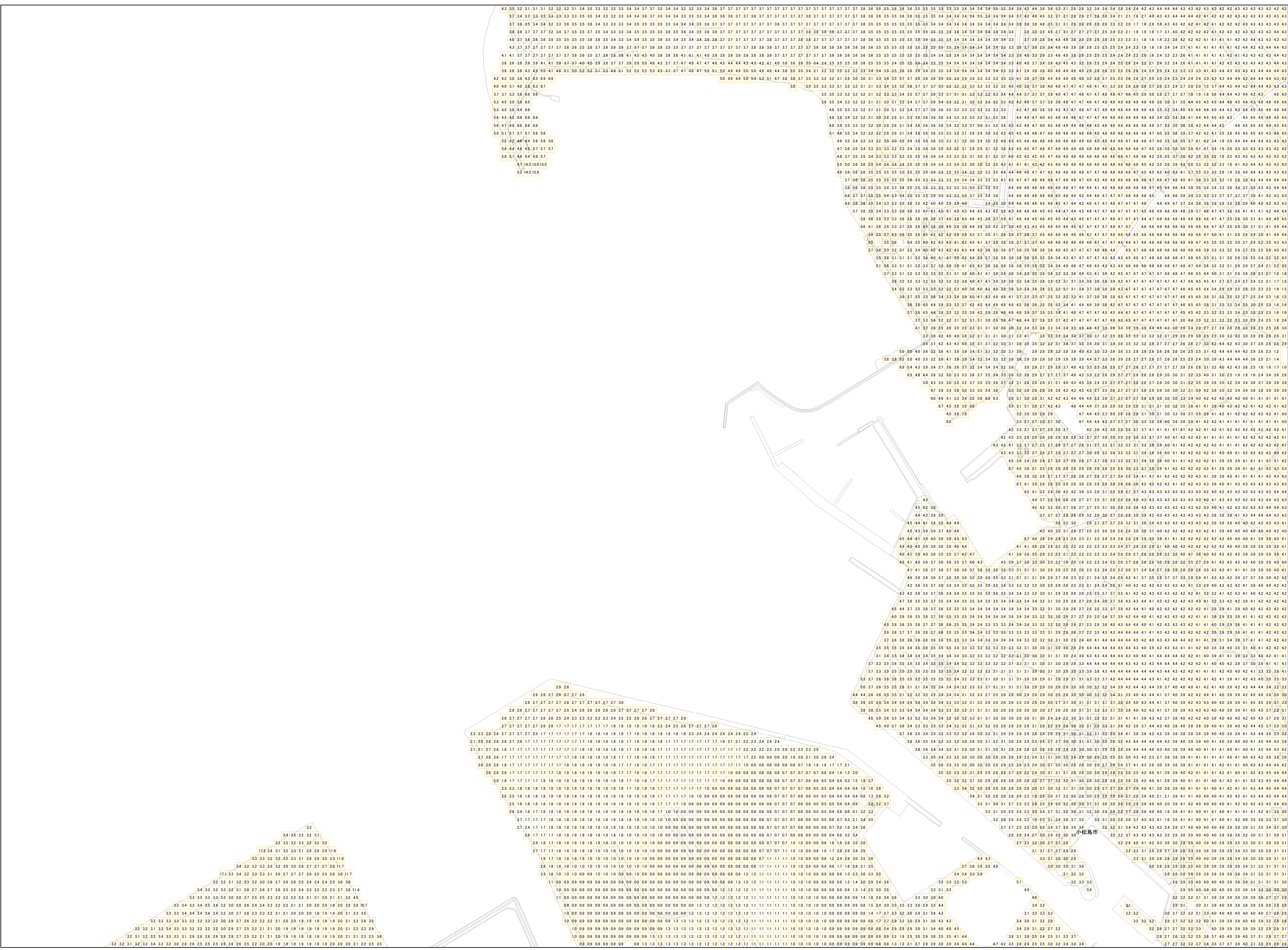
様式-2 津波災害警戒区域 区域図