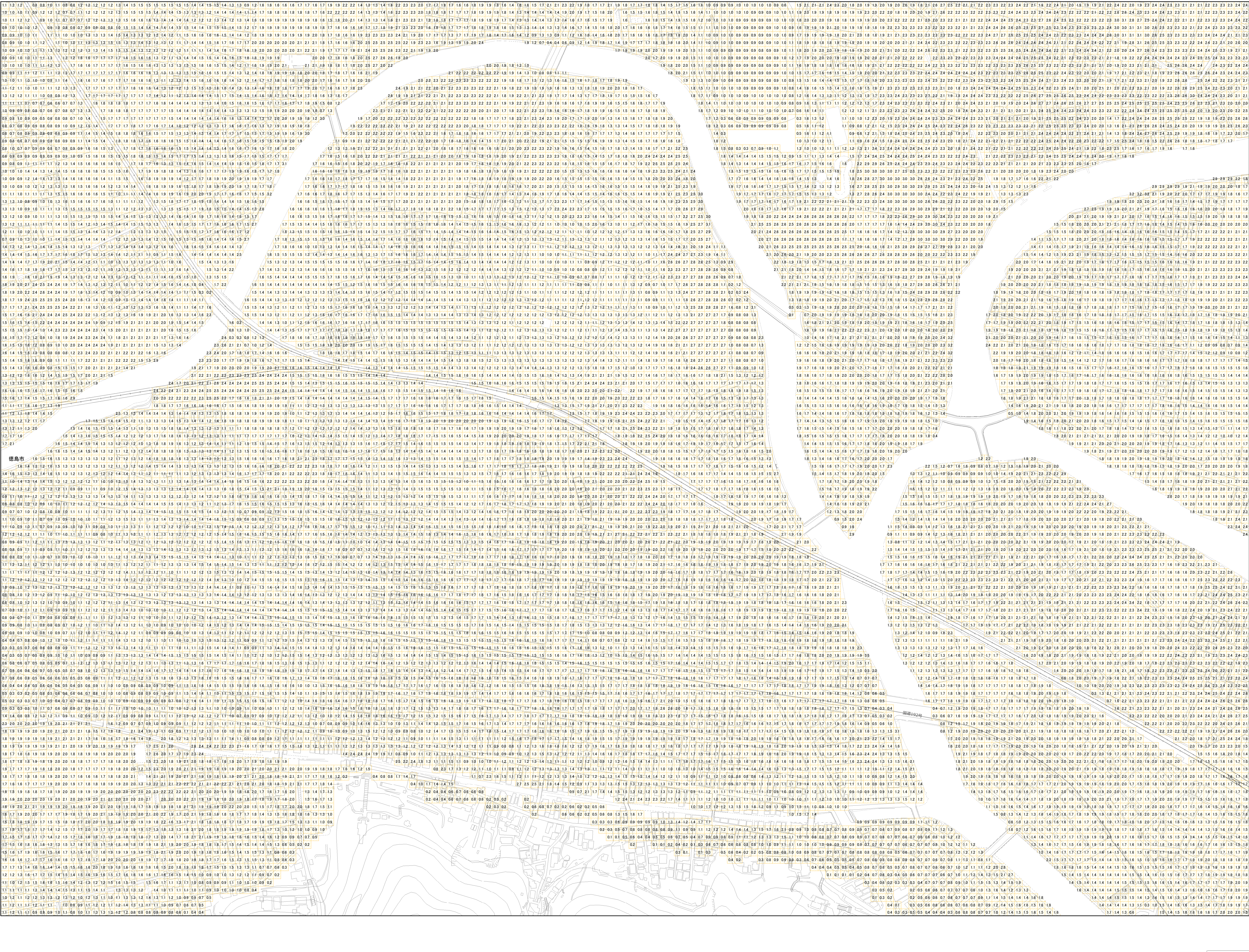
様式-2 津波災害警戒区域 区域図

【背景地図】 〇「背景地図」は、平成20年から21年の航空写真等を基に作成しているため、道路や建物などが現況と異なっている場合があります。