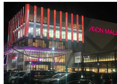
イオンモールライトアップ