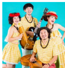
the Blue Lagoon Stompers