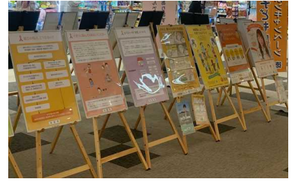
パネル展示イメージ