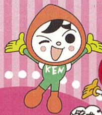
人権イメージキャラクター 左:人KENまもるくん 右:人KENあゆみちゃん