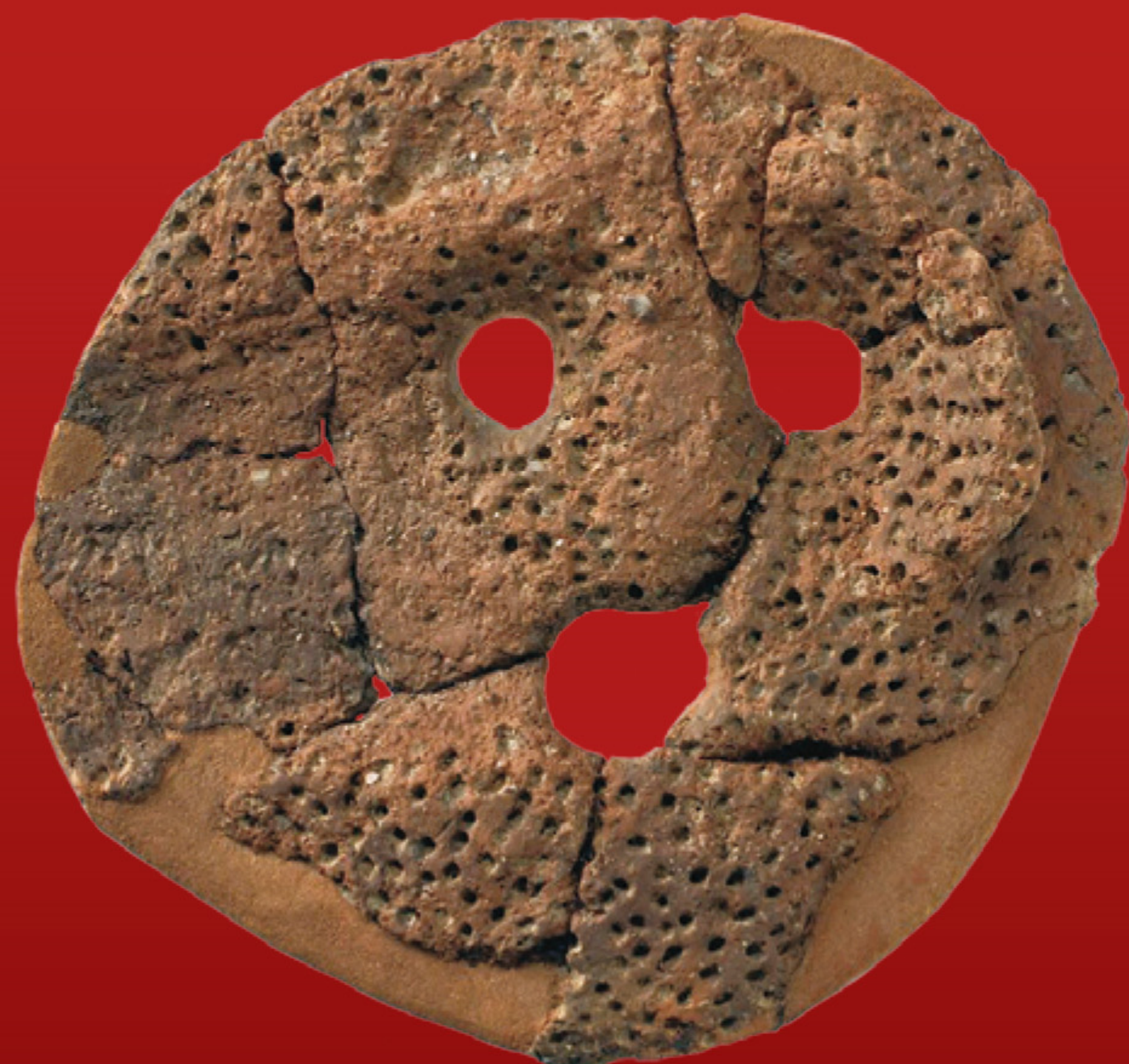
徳島市 矢野遺跡出土 土製仮面（縄文時代後期）国重要文化財