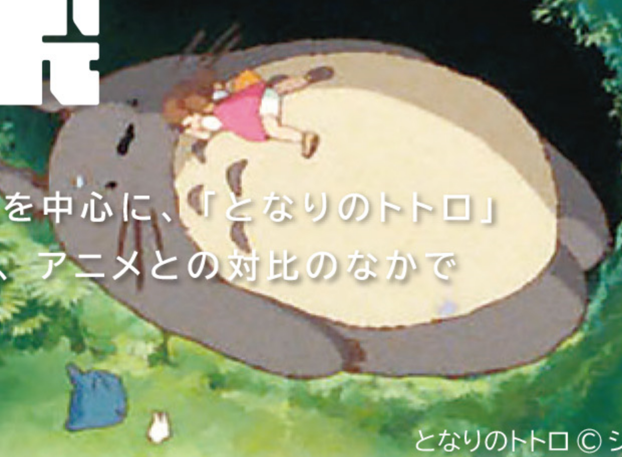
となりのトトロ ©ジブリ

「アニメのなかの コウコ楽」をテーマに、埋蔵文化財センターが実施した発掘調査の出土品を中心に、「となりのトトロ」「もののけ姫」などアニメ（ジブリ）の中に出てくる考古学に関連したモノを紹介しながら、アニメとの対比のなかで歴史的意義や地域の文化と古代の人々の暮らしの一端を展示します。