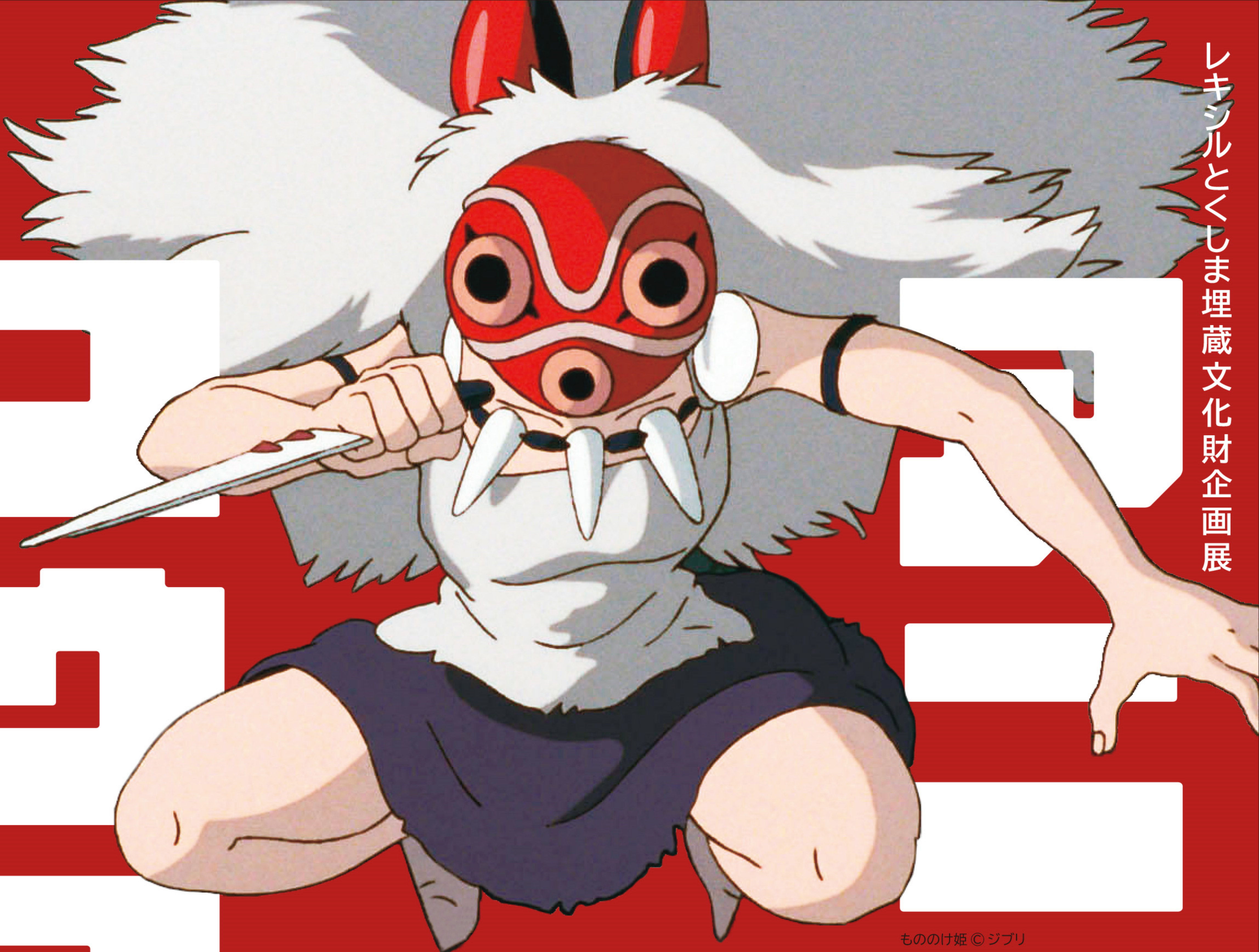
もののけ姫