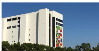
<大塚製薬株式会社>