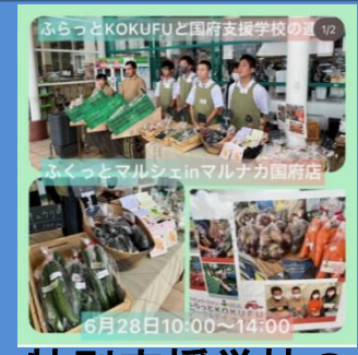
特別支援学校の 就労の取組を紹介