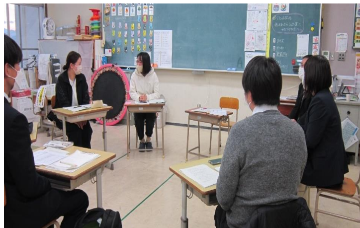
コンサルテーションの様子