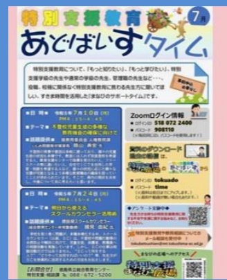
あどばいすタイムの 紹介