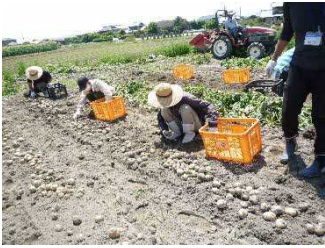
じゃがいもの収穫作業