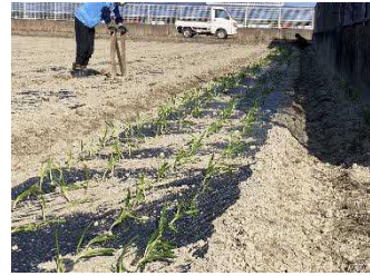
玉葱苗の植え付け作業