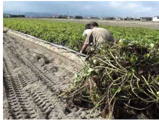
サツマイモつる刈作業