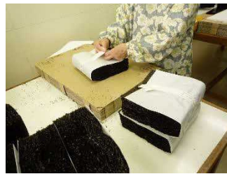
海苔の火入れ作業