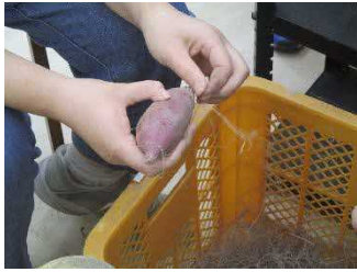
サツマイモの毛取り作業