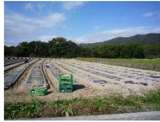
ニンニクの植え付け作業