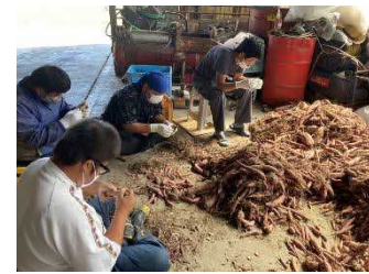
サツマイモ（餌用）の毛取り作業