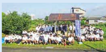
環境美化・保護活動に参加した鶴島第一中学校生

●皆さんからのご意見・ご感想をお待ちしています。 学校教育課 ☎088-621-3054 FAX088-621-2882