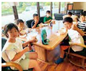
みんなで楽しく食べる「こども食堂」