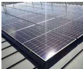
再エネ導入によりCO2を削減