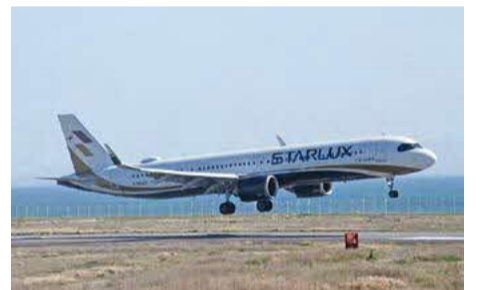
3年ぶりとなる国際旅客チャーター便

お問い合わせ先 財政課 ☎088-621-2052 FAX088-621-2827