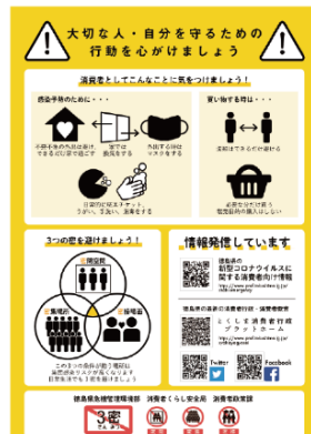
消費者として気をつけること