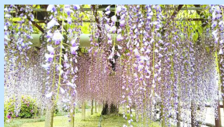
藤の花 徳島県名西郡石井町 地福寺