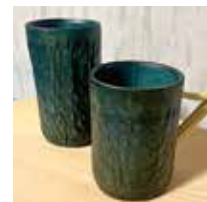
申込番号 W39 本藍染 竹マグカップ&竹コップ

徳島の竹と藍で作られた軽量で持ちやすい食器です (竹マグカップ直径7.5cm×高さ9cm、竹コップ直径7cm×高さ12cm)