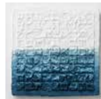
申込番号 W23 モザイクアートパネル + 藍染めぼかし