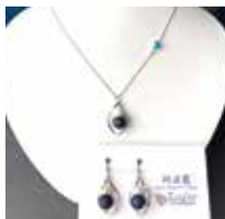
申込番号 W37 阿波藍ネックレス・ イヤリングのセット

藍が染め出す天然色が美しく上品な仕上がりに なっています(ネックレス首回り約60cm、イヤリング全長約3cm、貝パール6mm)