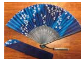
申込番号 W36 藍型染扇子 (ちょうちょ柄)

阿波藍で染めた扇子です。ちょうちょ柄を型染め技法で濃淡に染めました (扇子21cm×38cm(開いた状態))