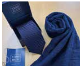
申込番号 W19 本藍染市松模様ネクタイとコットンストールのセット (勝色)

天然灰汁発酵建てによる本藍染のセットです〈ネクタイ長さ145cm、大剣幅8.5cm、ストール 144cm×28cm〉