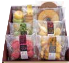
申込番号 Y125 徳島県産野菜 スイーツセット