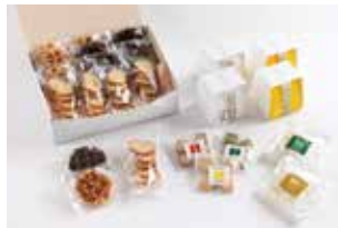
申込番号 Z01 パンヴィザン焼き菓子と 和三盆コロン・あわじずのセット

「PAN-VI-ZAN」パティシエの焼き菓子と、オリジナルブランド「プラスウィーツ」の焼き菓子セットです〈内容は季節により変わることがあります〉