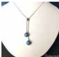
申込番号 W27 藍染パールの ネックレス

阿波藍で一粒一粒丁寧に染め上げたコットンパールのネックレスです (首回り50cm、コットンパール10mm)