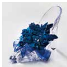
申込番号 W40 藍染花 シンデレラ

「灰汁発酵建染」という手法で染色した高級アートフラワーです (幅15cm×高さ12cm)