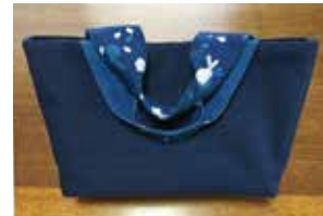
申込番号 W26 藍型染コットン バッグ (うさぎ柄)

軽くて持ち運びし易い藍染バッグです。型染技法でうさぎ柄に染めています〈W37cm×H22cm×D10cm〉