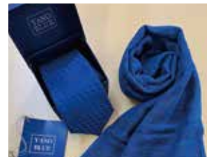
申込番号 W20 本藍染市松模様ネクタイとコットンストールのセット (縹色)

天然灰汁発酵建てによる本藍染のセットです〈ネクタイ長さ145cm、大剣幅8.5cm、ストール 144cm×28cm〉