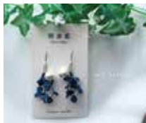
申込番号 Y119 藍の雫の耳飾り (ピアス)

阿波藍で染めたレース糸をタティングレースの技法で一目一目結って作った耳飾りです(全長 約4.5cm コットンパール8mm)