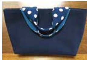
申込番号 W25 藍型染コットン バッグ (水玉柄)

軽くて持ち運びし易い藍染バッグです。型染技法で水玉柄に染めています〈W37cm×H22cm×D10cm〉