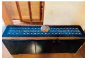
申込番号 W21 テーブルセンター

折紋りによって藍独特の濃淡を最大限にひき出された美しい模様です〈長さ196cm×幅35cm〉