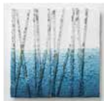
申込番号 W22 竹入アートパネル 竹藍染め