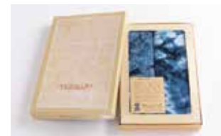
申込番号 Y04 藍染スポーツタオル・タオルセット

阿波藍で染め上げた群雲(むらくも)柄のタオルセット(手染めの為、柄は異なります)