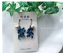
申込番号 Y120 藍の雫の耳飾り (イヤリング)

阿波藍で染めたレース糸をタティングレースの技法で一目一目結って作った耳飾りです(全長 約4.5cm コットンパール8mm)