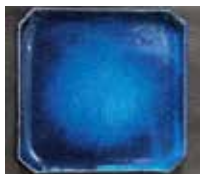
申込番号 Y122 藍-indigo-スクエアプレート (M)

藍染の染料を作る際に用いられる灰を再利用した釉薬を施しています(径約15.5cm×15.5cm 高さ約1cm)