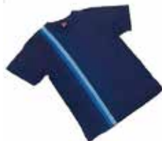
申込番号 W24 男女兼用 藍染Tシャツ

5.6オンスのしっかりとした綿を、丁寧な手作業で藍色に染め上げました〈サイズ/M~3XL〉