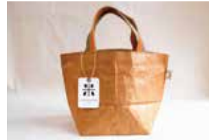
申込番号 Y128 米袋アップサイクル “コンドワバッグ”

お米を入れる紙袋をリメイクして制作した“徳島色豊かな”環境に優しいアップサイクルバッグです〈W17×H20×D15〉