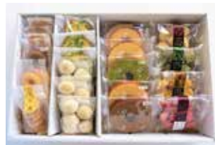
申込番号 Z34 徳島県産野菜スイーツ& バウムクーヘンセット