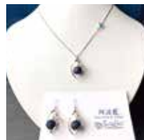
申込番号 W38 阿波藍ネックレス・ ピアスのセット

藍が染め出す天然色が美しく上品な仕上がりに なっています(ネックレス首回り約60cm、ピアス全長約3cm、貝パール6mm)