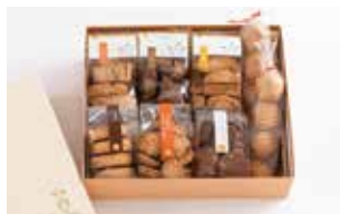
申込番号 Y02 ハーモニークッキー 詰合せギフト