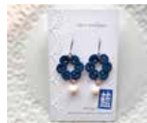
申込番号 Y131 藍染タティングレースのイヤリング

藍染の糸を一目一目丁寧に結って作った軽やかな耳飾りです(全長約3.5cm、マザーオブパール6mm)