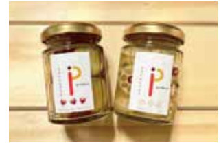
申込番号 Y102 徳島県産野菜 カクテルピクルス2種セット