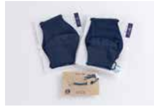
申込番号 Y101 藍染ガーゼマスク2枚(立体)・ ストラップセット