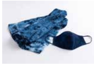
申込番号 Y100 藍染マスク・ タオルセット