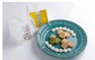
申込番号 Y01 和三盆コロン・あわじずくBOXセット

上品な甘さとサクサク食感“和三盆コロン”、くちどけ優しいメレンゲ菓子“あわじずく”のセットです