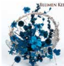
申込番号 W01 藍染花

上品な藍染花は、あらゆる空間装飾やギフトとして最適です〈高さ35cm×横35cm〉