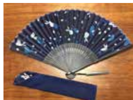
申込番号 W35 藍型染扇子 (うさぎ柄)

阿波藍で染めた扇子です。うさぎ柄を型染め技法で濃淡に染めました (扇子21cm×38cm(開いた状態))