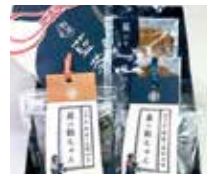
申込番号 Y121 ボン・アームの食べる藍セット

農業を使わず育てた徳島県産タダ藍を使用したアイを食べるセットです(阿波藍茶(5包)、藍の飴ちゃん(木頭柚子、海部乃塩 各1袋)、藍びすこっい(2枚))