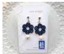
申込番号 Y130 藍染タティングレースのピアス

藍染の糸を一目一目丁寧に結って作った軽やかな耳飾りです(全長約3.5cm、マザーオブパール6mm)