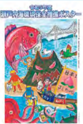
令和5年度 瀬戸内海環境保全推進ポスター 前田知輝さん(吉野川市)の作品

【問】環境管理課 ☎088-621-2272 FAX088-621-2847 詳しくはこちら