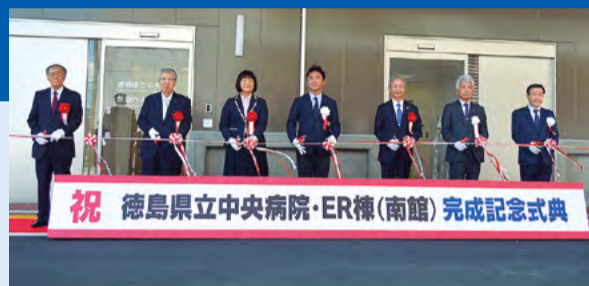
●5月21日に完成記念式典を挙行。内覧会も開催しました。