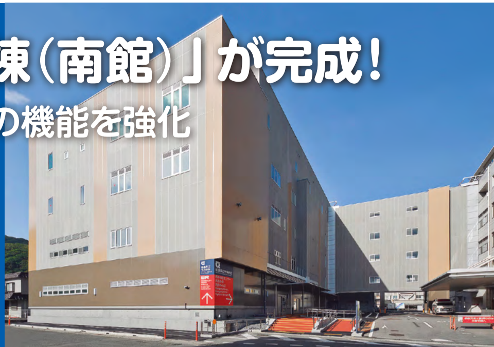
●ER棟(南館)全景。地上5階建てで、地震に強い免震構造を採用。2～5階部分が、渡り廊下で本館棟(右側)と接続します。