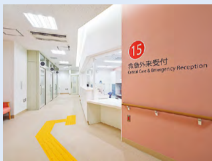
●救急・感染症外来(1階)

全面陰圧化された「救急・感染症外来」では、救急患者の受入れを強化し、今後の新興感染症にもしっかり対応します。また、拡充された「内視鏡センター」では、がん診療の拠点病院としての検査・治療体制を強化します。さらに、陰圧設備を備えた「HCU(高度治療室)」では、重症感染症患者への治療にも対応します。