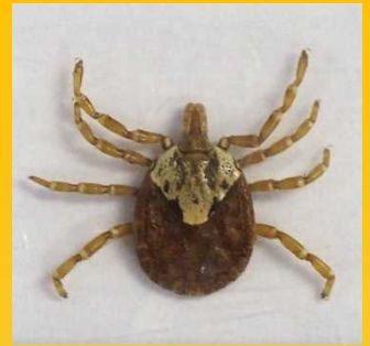
タカサゴキララマダニ