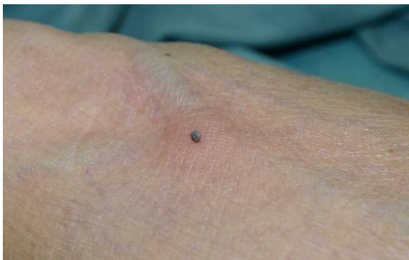
腕を刺咬するマダニ