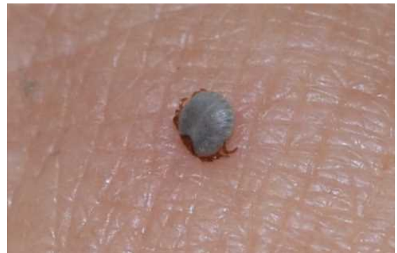
拡大写真:タカサゴキララマダニ