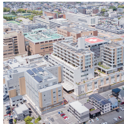
徳島県立中央病院 本館とER棟（南館）

設置場所や病院規模に違いはありますが、いずれも地域医療の中核を担う病院として運営されています。「県立病院があるから、安心して暮らせませす」と県民から言っていただける病院に、それが私たちの願いです。