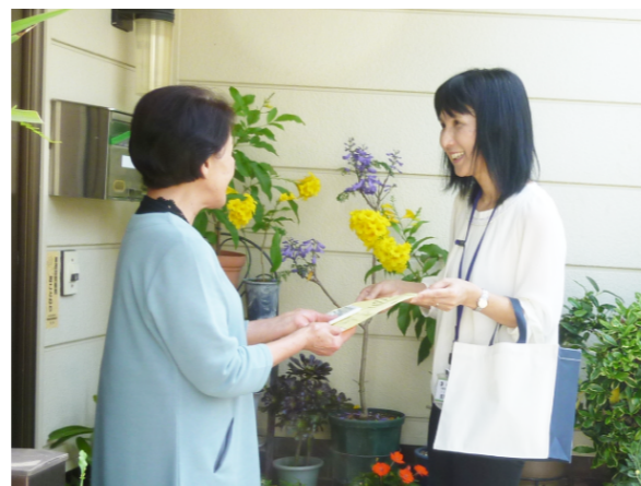
一人暮らしの高齢者などを訪問 何かあれば相談していただけるよう 声かけをしている。