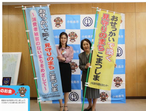
オリジナルのキャッチフレーズをのぼりに。