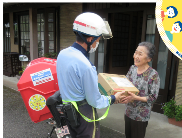
郵便局員による見守り活動 バイクにはステッカーが。