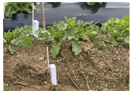
土壌水分センサー（白い機械）

遠隔地にある農地に設置した土壌水分センサーからリモートセンシング技術を用いてデータを収集し、その保水性の高さを立証することができました。