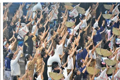
インターハイ総合開会式