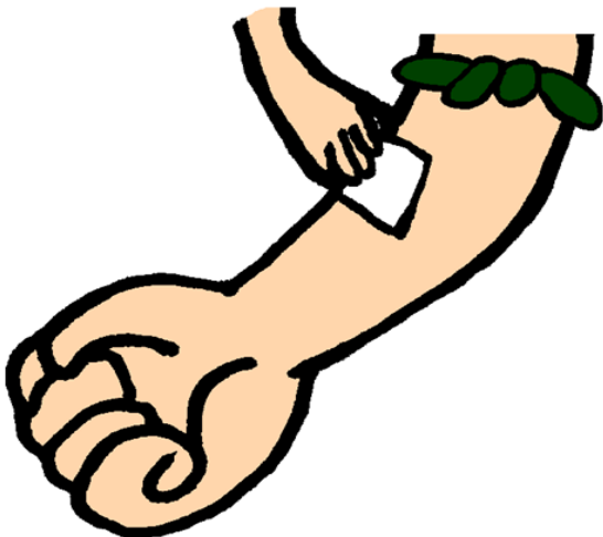
③ しょうどくをする