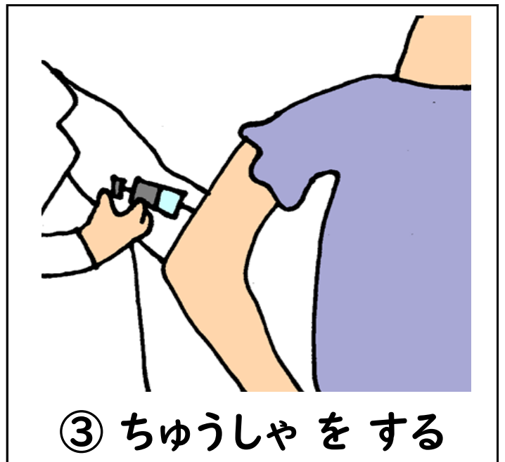
③ ちゅうしゃをする