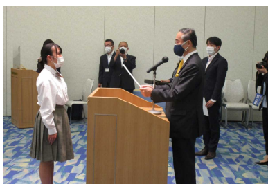
スーパーオンラインハイスクール事業

○農・工・商といった職業教育を主とする専門学科に対し、教育内容が画一的になりがちな普通科においても、生徒や学校、地域の実態に応じ、例えば、将来の職業を意識した実践的な学びを深められるコースを設置したり、単位制を活かして特色ある学校設定科目を設けたりするなどの工夫を求めたい。