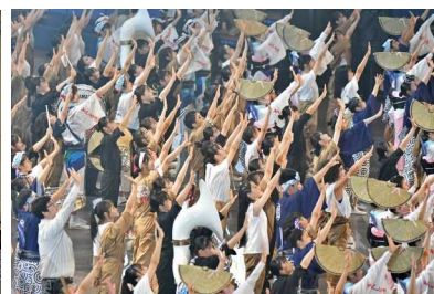
インターハイ総合開会式