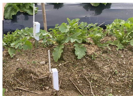
土壌水分センサー（白い機械）

遠隔地にある農地に設置した土壌水分センサーからリモートセンシング技術を用いてデータを収集し、その保水性の高さを立証することができました。