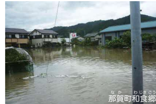
町の広い範囲で住宅などが浸水