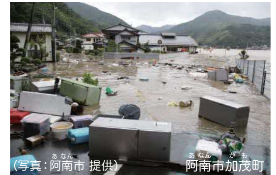
家の中まで水が押し寄せ、家電や家具が道路まで流出