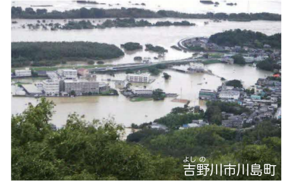
山際から吉野川の堤防までの広い 範囲が水没