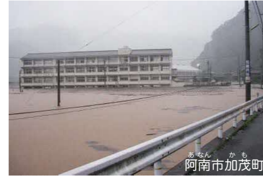
建物の1階部分が水没した中学校 周辺では多くの住宅などが浸水